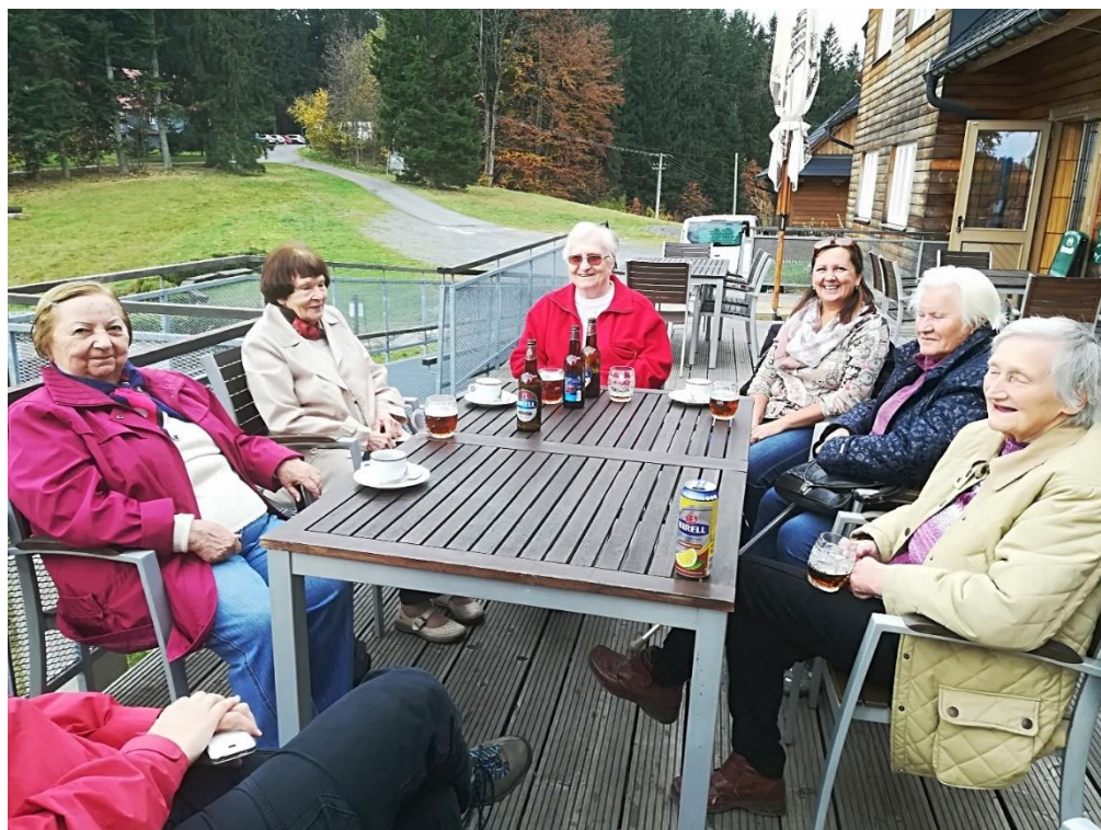
Výlet na Grůň

Pro rok 2019 je plánováno rozšíření služby Senior Taxi do okolních obcí v rámci obce s rozšířenou působností. Svoji činnost služba zahájila 2. 1. 2019.