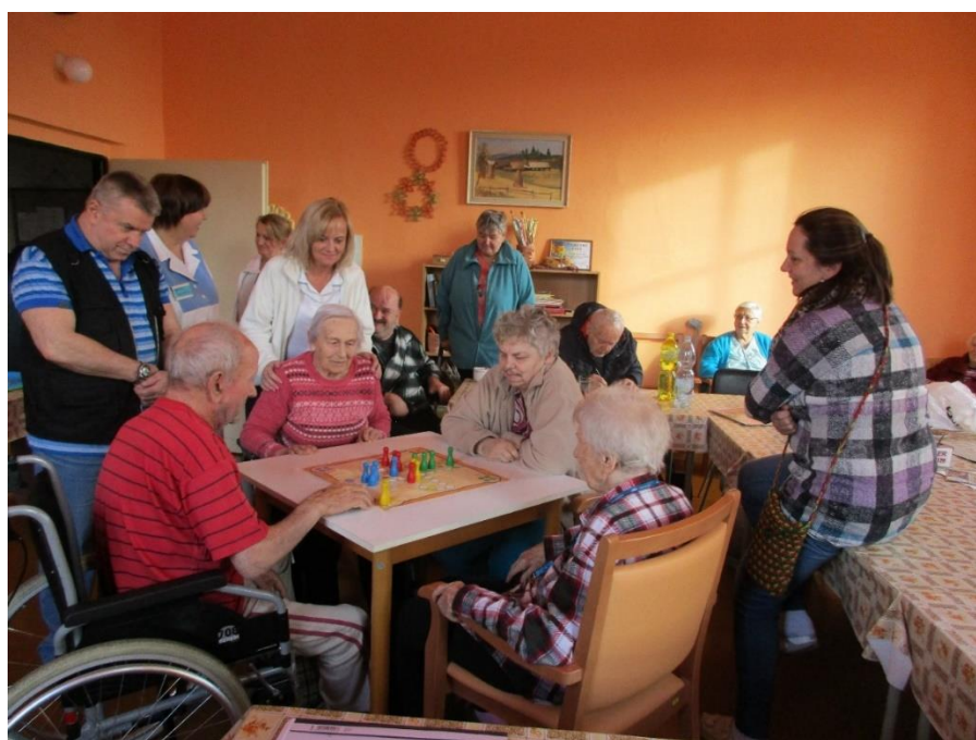
Člověče, nezlob se!

Klienti i rodinní příslušníci si na tuto službu již zvykli a mnozí ji využívají opakovaně.