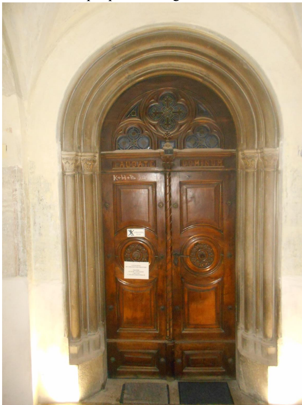
Vstup do kaple Neposkvrněného početí Panny Marie ve Středisku sociálních služeb města Frýdlant nad Ostravicí prosinec 2018

Středisko sociálních služeb města Frýdlant nad Ostravicí, příspěvková organizace