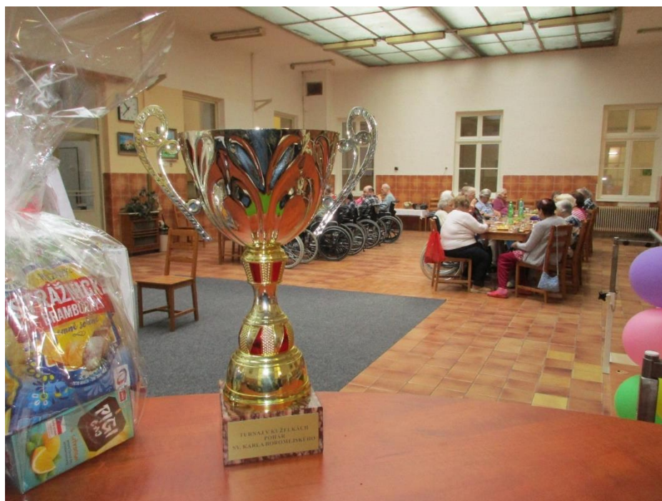
Turnaj o pohár sv. Karla Boromejského

„Podle mého názoru účetní závěrka podává věrný a poctivý obraz aktiv a pasiv příspěvkové organizace Středisko sociálních služeb města Frýdlant nad Ostravicí k 31. 12. 2018 a nákladů, výnosů a výsledku jejího hospodaření a peněžních toků za rok končící k 31. 12. 2018 v souladu s českými účetními předpisy.“