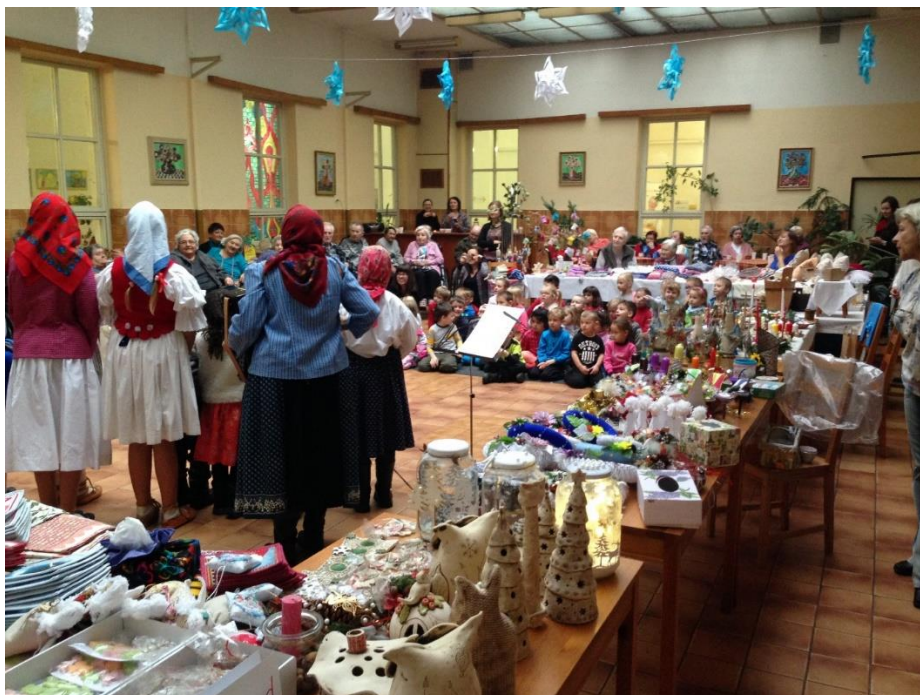
Vánoční jarmark s vystoupením

Existence altánu silně absentuje v prostorách Střediska, především z důvodů nařízeného kácení stromů, které, byť skýtaly stín, byly s ohledem na svůj stav nebezpečím pro naše uživatele i návštěvníky. Důvodem výstavby altánu je především nedostatek stinných míst a bezpečné prostředí pro naše seniory.