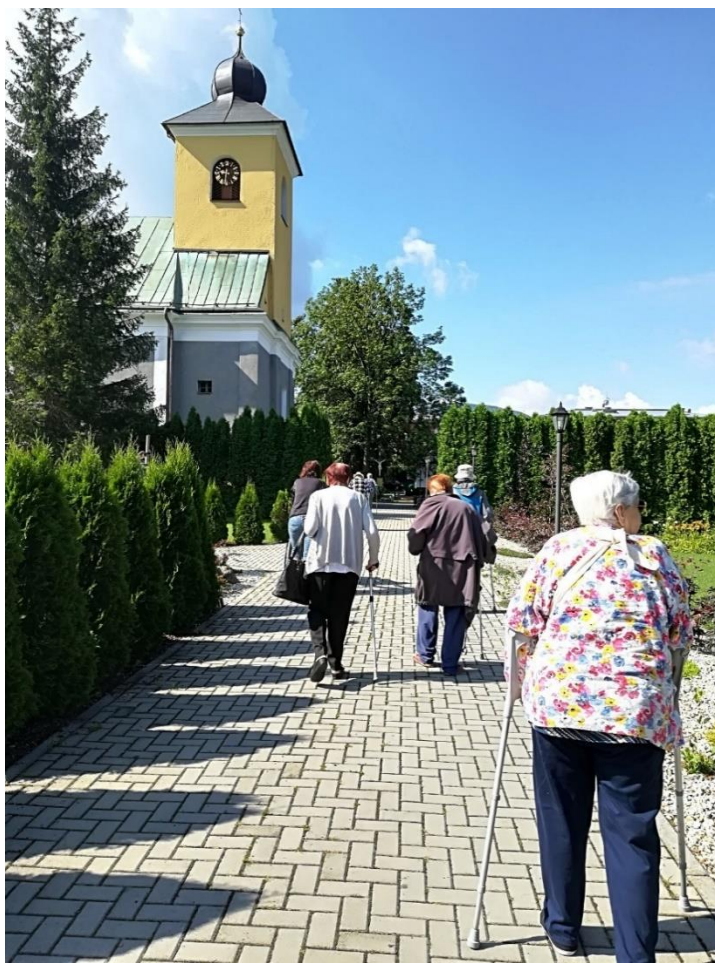
Výlet na Čeladnou