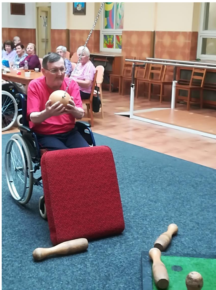
Turnaj v kuželkách