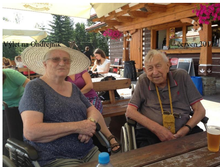
Výlet na Ondřejník

V roce 2018/2019, podle finančních možností, bychom rovněž rádi vystavěli prostorný altán pro posezení našich uživatelů se zajištěním bezbariérového přístupu a rekonstrukci rampy pro zajištění příjezdu sanitních vozidel. Existence altánu velmi silně absentuje v prostorách Střediska, především z důvodů nařízeného kácení stromů, které, byť skýtały stín, byly s ohledem na svůj stav nebezpečím pro naše uživatele i návštěvníky. Důvodem výstavby altánu je především nedostatek stinných míst a bezpečné prostředí pro naše seniory.