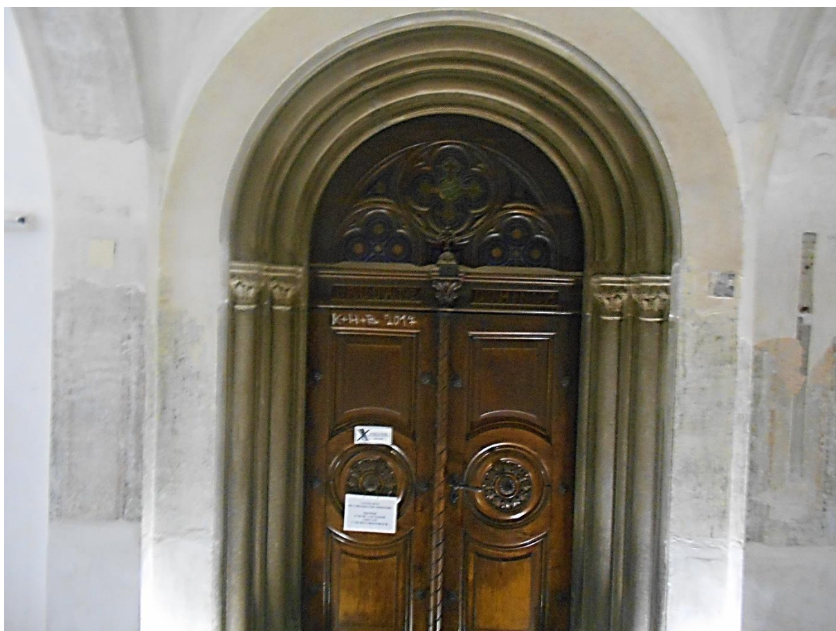
Vstup do kaple Neposkvrněného početí Panny Marie ve Středisku sociálních služeb města Frýdlant nad Ostravicí