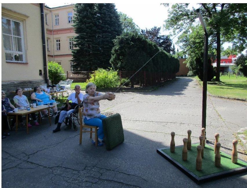
Turnaj v kuželkách

„Podle mého názoru účetní závěrka podává věrný a poctivý obraz stavu aktiv a pasiv příspěvkové organizace Středisko sociálních služeb města Frýdlant nad Ostravicí k 31.12.2017 a nákladů, výnosů a výsledku jejího hospodaření a peněžních toků za rok končící k 31. 12. 2017 v souladu s českými účetními předpisy.“