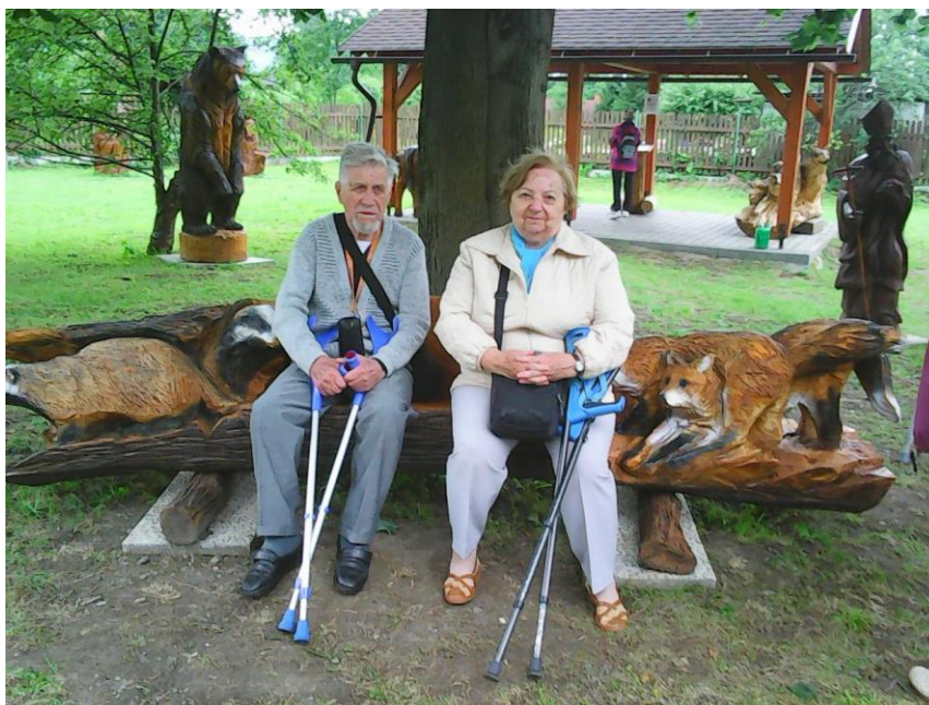
Návštěva obce Ostravice

V závěru roku 2017 jsme rovněž získali investiční finanční příspěvek ve výši 300 000,-Kč z Moravskoslezského kraje na zakoupení konvektomatu do kuchyně. Náklady na zakoupení konvektomatu činily celkem 340 086,-Kč.