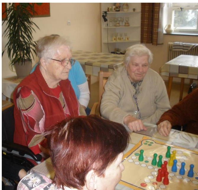
Turnaj Člověče, nezlob se