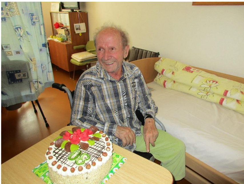
Oslava narozenin klienta